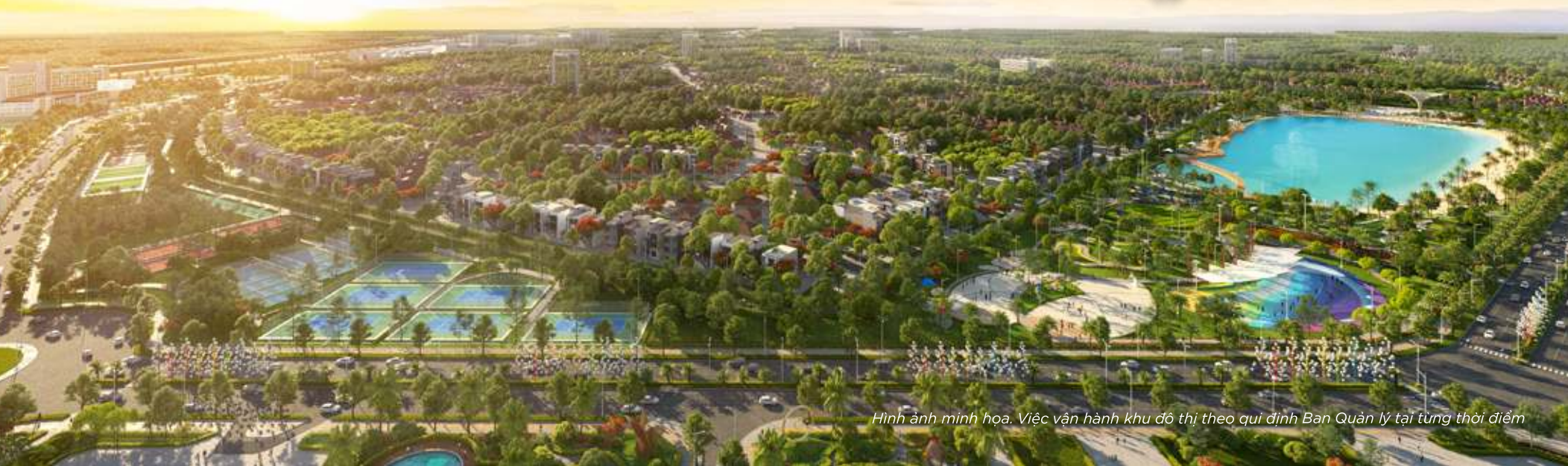
Hình ảnh minh họa. Việc vận hành khu đô thị theo quy định Ban Quản lý tại từng thời điểm