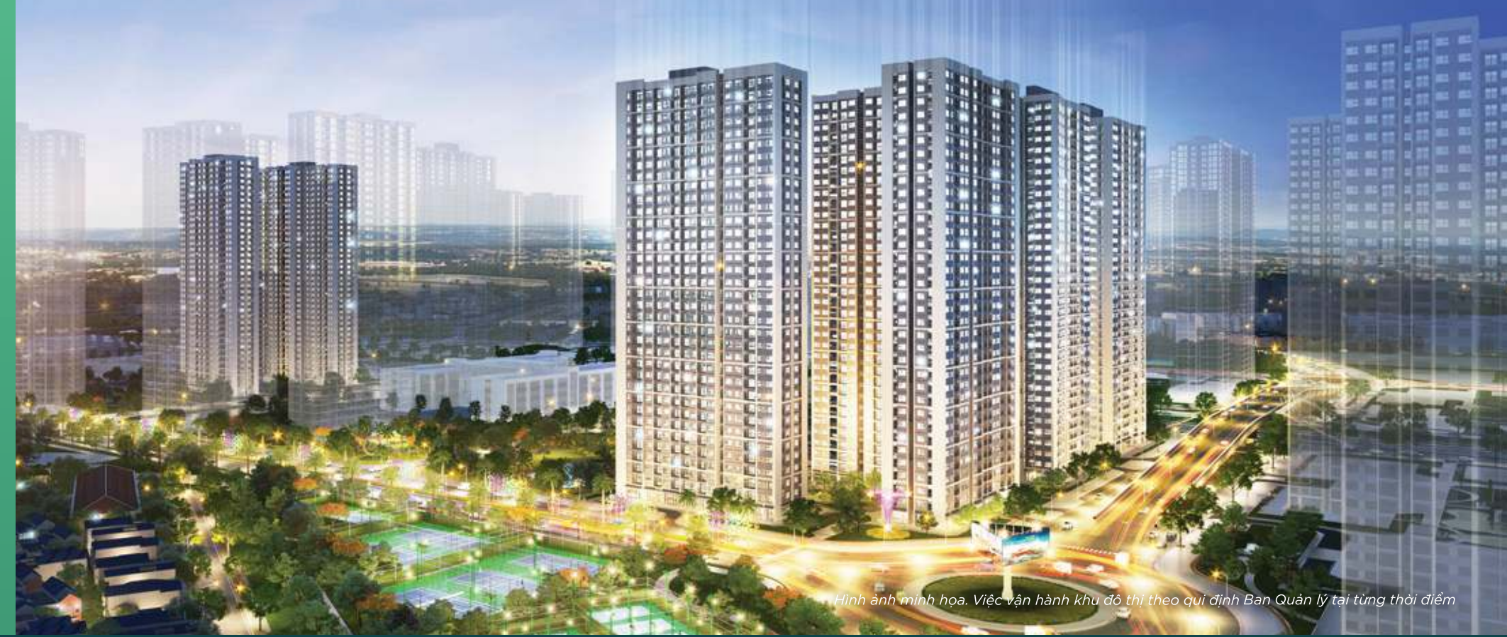
Ảnh minh họa. Việc vận hành khu đô thị theo quy định Ban Quản lý tại từng thời điểm